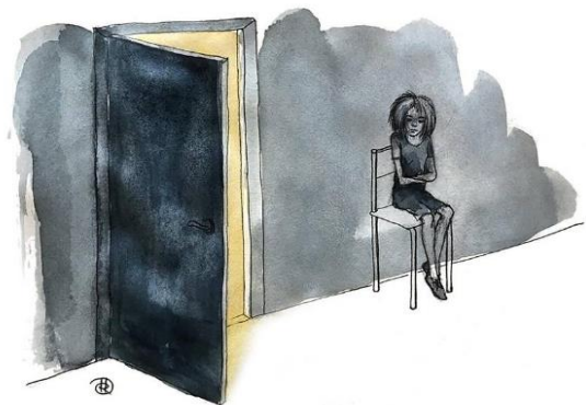
Illustration: Rina Kjeldgaard

Du har allerede oplevet så meget lort i dit korte liv: ting du ikke engang tør fortælle din psykolog. Selv om du lige nu synes, at barberbladet og anoreksien er din bedste ven, så skal det hele nok ændre sig.