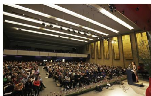
PsykiatriNetværket holder dette års Psykiatritopmøde lørdag den 7. oktober 2017 på Sankt Annæ Gymnasium i Valby ved København.

Klik her for at gå til hjemmesiden , hvor du kan se tid, sted, program og tilmelde dig. Topmødet kan også findes som begivenhed på Facebook .