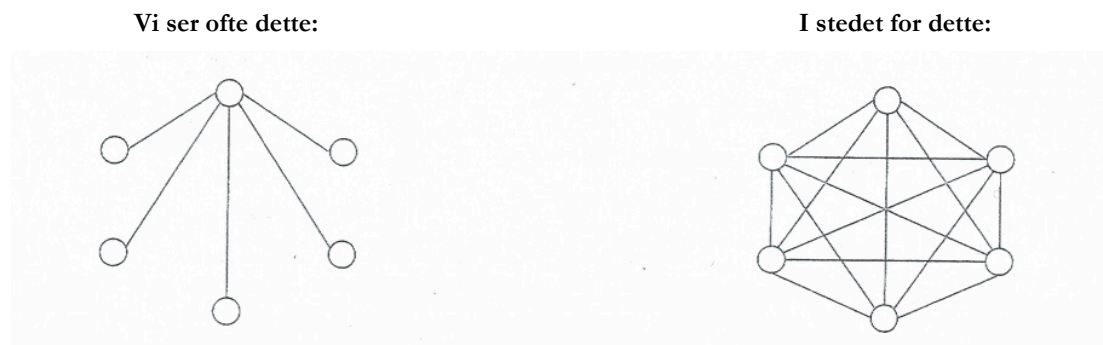
Figur 2 Kommunikation i grupper

Ideelt set skulle denne problemstilling ikke være aktuel i forbindelse med selvhjælpsgrupper, der netop adskiller sig fra socialt gruppearbejde og gruppeterapi ved at være selvstyrende – altså uden gruppeleder. Men da selvhjælpsgrupper i virkelighedens verden undertiden, også i denne undersøgelse, er organiseret med en gruppeleder, er spørgsmålet om gruppedynamik et væsentligt tema for selvhjælpsgruppearbejdet med voksne, der i barndommen har været udsat for seksuelle overgreb.