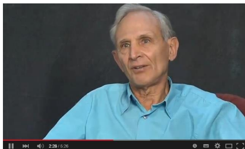
Peter A Levine, PhD speaks to ADHD in Relation to Trauma

Artiklen er bragt i Tidsskrift for Norsk Psykologforening men er forbeholdt abonnenter indtil 1. oktober 2015. Indtil da kan der læses en kort norsk indledning og et kort engelsk resumé på siden .